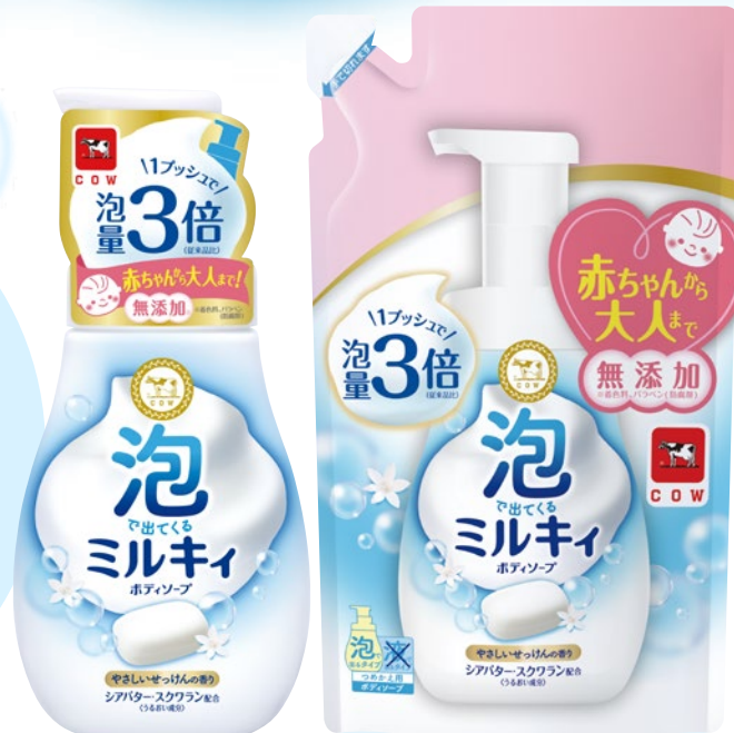
泡でてくる ミルキィボディソープ〈やさしいせっけんの香り〉 ポンプ付: 550mL / 詰替用: 450mL オープン価格